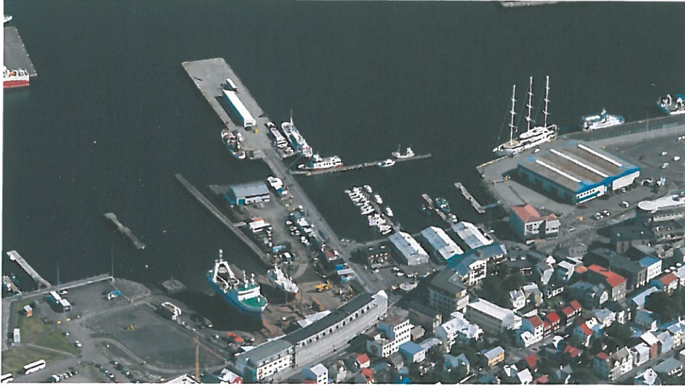
Mynd 7. Loftmynd sem sýnir Suðurbugt