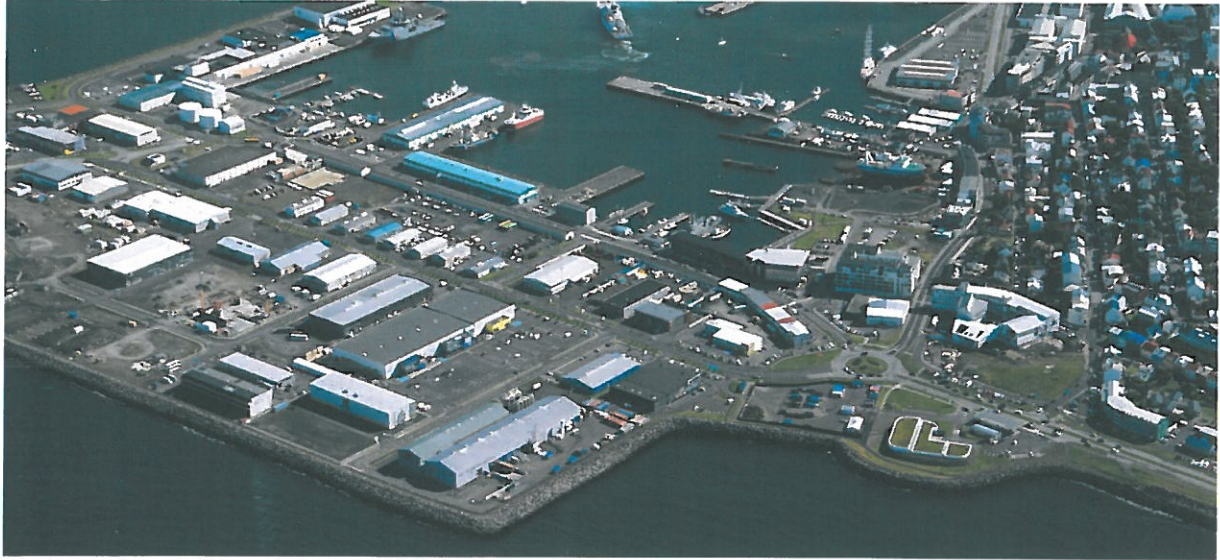
Mynd 10. Loftmynd af Vesturhöfn og Fiskislóð