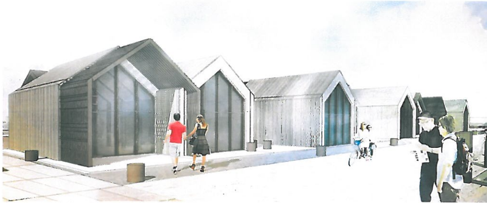
Mynd 8. Söluhús við Ægisgarð, mynd fengin hjá Yrki arkitektum

Stefnt er að því að bjóða verkefnið út í byrjun mars og að tilboð verði opnuð lok mars 2019. Gert er ráð fyrir því að smíði húsanna geti hafist í apríl, og að þau verði tilbúin í nóvember, og að það verði hægt að flytja þau á Ægisgarð þegar jarðvinnu þar er lokið í byrjun næsta árs. Mikilvægt er að tryggja að svæðið verði tilbúið næsta vor.