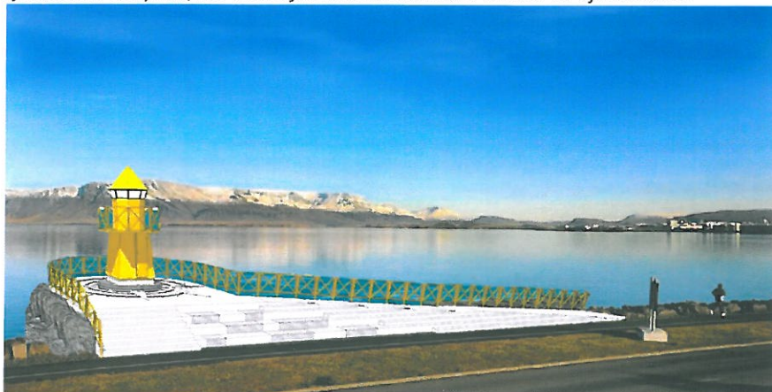
Mynd 6. Mynd af vitanum úr kynningargögnum frá Reykjavíkurborg

Kostnaður við Vita við Sæbraut var að mestu á árinu 2018 samkvæmt samningi við Reykjavíkurborg. mkr. Vitin verður settur upp á næstunni, tengdur rafmagni og í framhaldi verður nauðsynleg breyting á sjókortum tilkynnt, en viti í Sjómannaskólanum tekinn úr sjókortum.