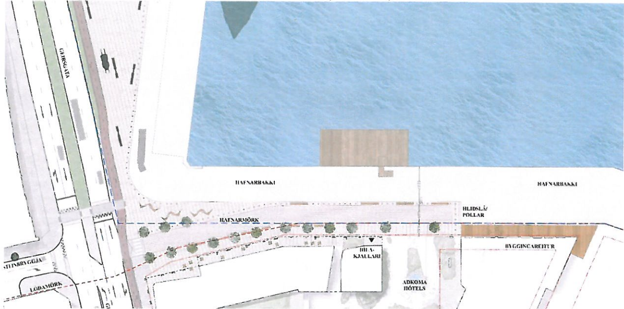
Mynd 3. Drög að hönnun götu á Austurbakka frá teiknistofunni Landslagi

Vísbendingar eru um að Reykjavíkurborg muni að flýta framkvæmdum á nýrri götu á Austurbakkanum sem á að liggja frá Geirsgötu að innkeyrslu í bílajakallara og að hóteli við Austurbakkann. Samhliða framkvæmdum Reykjavíkurborgar á bakkanum þarf að endurnýja og leggja ný veitukerfi að stöðinni á Faxagarði auk þess sem gera þarf ráð fyrir niðurfalalinu á bakkanum. Ekki liggja fyrir útfærðar teikningar vegna framkvæmda við götu á Austurbakka, en brýnt að Faxaflóahafnir fái þær teikningar til að mögulegt sé að skipuleggja og undirbúa þær framkvæmdir sem myndu tilheyra höfninni.