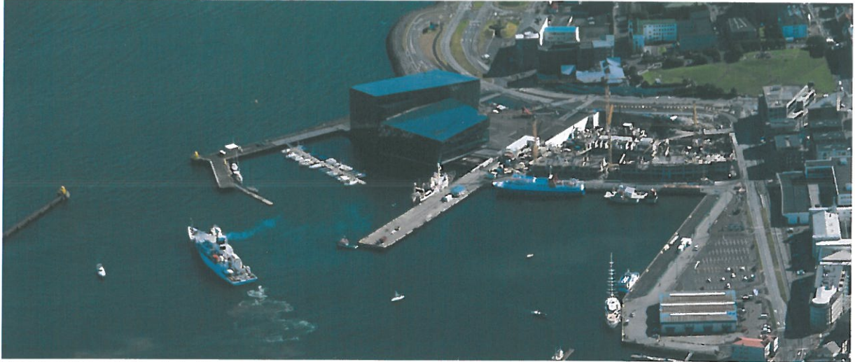
Mynd 1. Loftmynd af Austurbakka