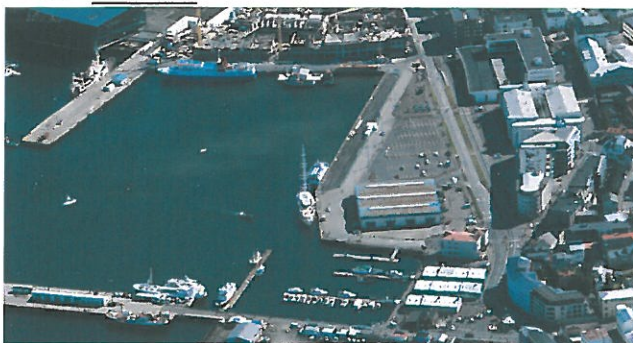
Mynd 4. Loftmynd af Miðbakka