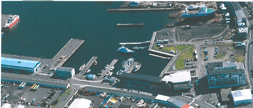
Loftmynd af Vesturbugt